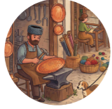
Tükân лавка, магазин