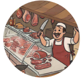
Qasap tükânı мясная лавка