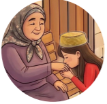
El öpmek целовать руку