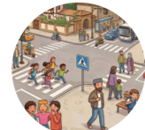
Yol çaprazı перекресток