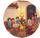
Musafir odası гостиная

Aqşam yemegi qırımtatar ailesiniñ ananeleriniñ ayrılmaz bir parçasıdır. Büyük sofa etrafında tuvğanların bir qaç nesli toplana. Sofrağa milliy yemekler qoyula. Böyle körüşüvler tuvğanlıq bağlarını qaviyleştire ve aile birliğini emiyetini hatırlata.