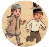
Bayram urbası праздничная одежда