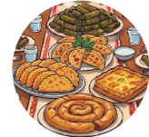
Sofra обеденный стол