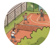
Sport meydanı спортивная площадка