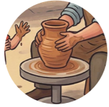
Çölmekçi çarqı гончарный круг