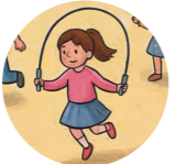
Atlama yiri скакалка