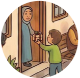
Musafir qarşılamaq встречать гостей