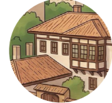
Kiramet damı черепичная крыша