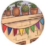
Bayram bezekleri праздничные украшения