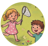
Ağıl kepçe сачок