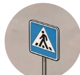
Yol işareti дорожный знак