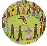
Horan хороводный танец Хоран