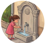
Çeşme фонтан, источник