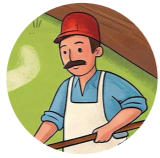
Çiberekçi продавец чебуреков