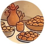
Bayram aşıları праздничная еда