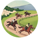
At qoşusu конные скачки