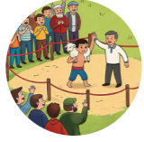
Küreş meydanı площадка для борьбы