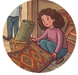
Esnaf ремесленник, мастер

Esnaflar mahallesi halqñın ananeleri canlanğan hususiy bir yerdir. Mında ustalar kilimler toquy, çölmek yasay, nağış nağışlay ve yaş nesilge öz zenaatlarınñ ineliklerini ögreteler. Halq sanat ustaları baba-dedelerimizniñ hatırasını, olarnıñ emegini ve ana-vatannıñ güzelligini saqlap qalmağa yardım ete. Büyükler kiçiklerge öz zenaatına sevgi aşılap olsalar, o zaman milliy ananeler de yaşamağa devam eter. Qırım tatar medeniyeti böyle etip qorçalanır ve nesilden nesilge keçip kelir.