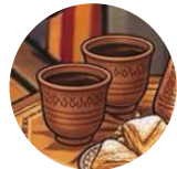
Filcan кофейная чашка