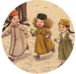
Bayram muiiti праздничная атмосфера